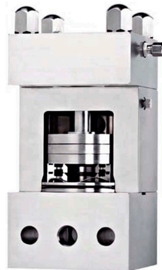
Patentiertes Micro-Gap Ventil

Die Ergebnisse eines Einsatztests unter Realbedingungen zeigten, dass im Vergleich zu konventionellen Ventilen, die höhere Drücke benötigen, jährliche Einsparungen bis 15.000,- Euro möglich sind.